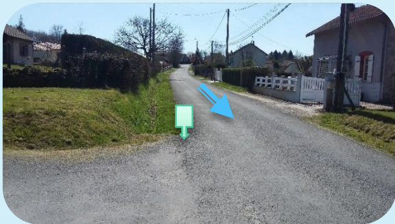
Un stop à l'entrée de la Rippe.

Une réunion d'information s'est déroulée le samedi 11 avril 2015, entre la municipalité et les riverains. Celle-ci avait pour but de présenter les modifications sur le hameau de la Rippe et sur la rue du Pinier. Beaucoup de riverains étaient présents à ce rendez-vous. Après discussion, nous avons validé plusieurs modifications qui interviendront début mai 2015.